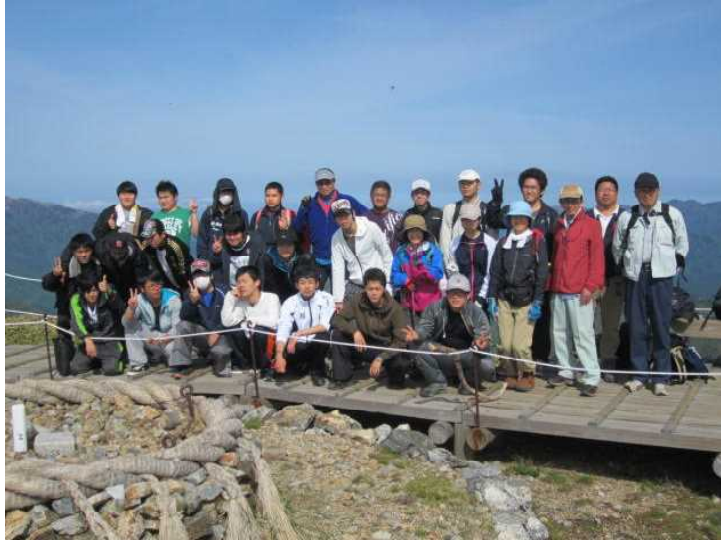
2日目は、剣山頂上で記念撮影し、いざ出発。

5月14日(木)と15日(金)に1年次生が、剣山登山を行いました。2日間ともに快晴で、3つの頂上に登りました。