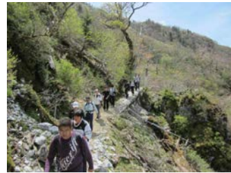
下山も険しい断崖絶壁。