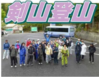
見ノ越を出発です。