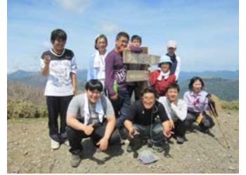
三つ目の頂き、次郎笈。