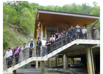
見ノ越に帰ってきました。