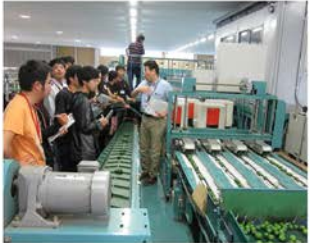
JA徳島市佐那河内支所

第1回目は「JA徳島市佐那河内支所」において、選果場と農産工場を見学し、徳島すだちの生産・管理、加工、流通等について説明を受けました。第2回目は、「JA東とくしまあいさい広場」で、組合の組織概要や経営状況について説明を受け、店舗を見学した後、ディスプレイや価格を調査しました。