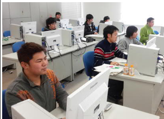
夕方遅くまでコンピュータ室にこもる学生