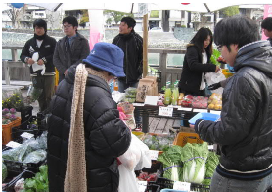
わくわく日曜日(徳島市)に出店 12月21日