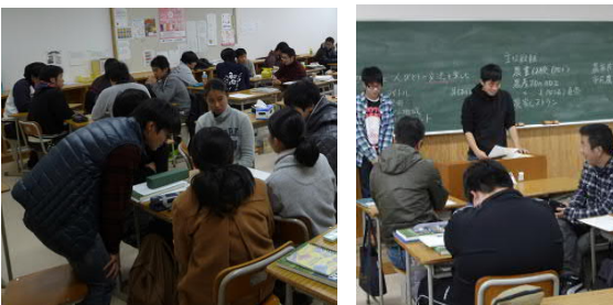
グリーンツーリズムの授業でのワークショップ