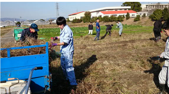
収穫圃場の撤収作業(後片付け)