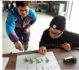
ニンジンの発芽調査