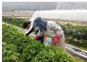
葉大根、菜の花の収穫