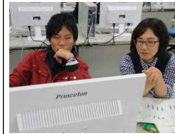
プリムラ(花)は冷蔵処理で開花促進するのか？ ゴウシュイモに適した土壌は？ 枝豆はマルチ栽培するのいい？ 2年次生は、プロジェクト中間発表会が間近。パソコン室や職員室でマンツーマン指導を実施。