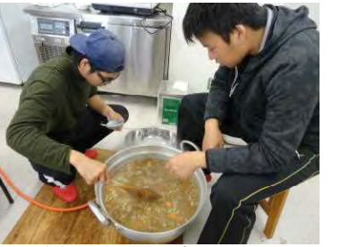
大鍋で作ると旨味がたっぷり