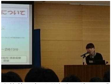
本格的に冬が到来する前に、感染症対策講座が開かれました。