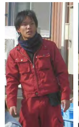
自治会長のお礼の挨拶でいただきます。