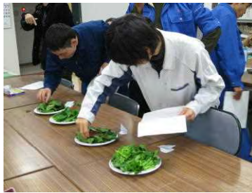
外見をしっかりと確認。生食で十分おいしい！ 学生プロジェクトの4種類のサラダほうれん草を試食。