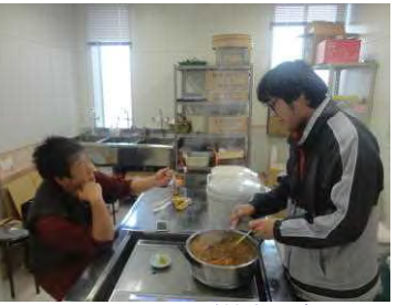
じっくり煮込めば最高の味