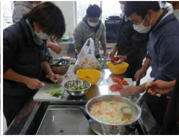
俺たちのカレーはうまいぞ