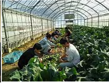
ほ場での実習体験