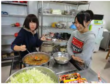
私たちのカレーが一番

11月の最後は、学生みんなが楽しみにしていた収穫祭。6月始め、1年次生が入学したばかりの頃、2年次生が、新入生歓迎行事としてバーベキューでもてなしました。この収穫祭は、1年次生が2年次生に対して、バーベキューのお返しと、11月初旬の農大祭成功の労をねぎらうものです。今年のメニューは、カレー、サラダ、フルーツポンチ、ピザ。お昼までに、1年生が料理作りと会場設営。その間、2年次生は、プロジェクト中間発表会の準備に専念します。