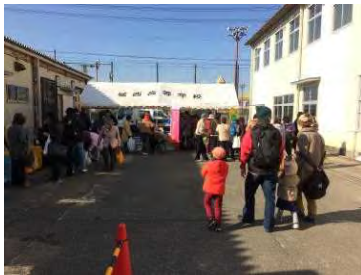
晴天に恵まれ開店！ 城西高校の耕心祭に出店。沢山用意した商品が昼過ぎに完売！