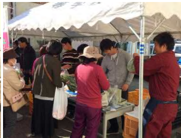
多くの来客がありました。