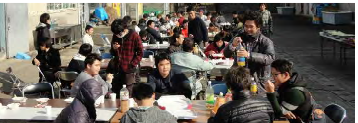
晴天の中、作業舎前は、大勢でにぎわう野外レストランに変身！