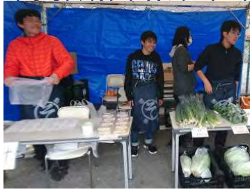
開店準備がやっとできました！ 接客に熱がこもります。中央自動車教習所のお祭りので、出張販売してきました。