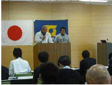
職員と学生で説明します。県内高2生が、センターと農大のことを知ろうとやってきました。