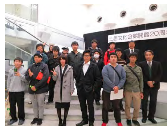
発表お疲れ様。全員で記念撮影。

地域の農業はどうあるべきか、農業を通して地域社会にどう貢献するのか、そして、自分は農業とどう向き合うのか。今回の発表にあたり、夏に発表の素案となる作文を書き、秋に校内選考を通過し、冬に練習を重ねました。