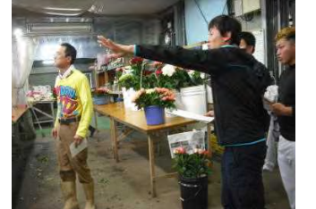
岡松バラ園を訪問しました。