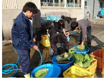
ハクサイの出荷調整(12/09)