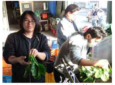
ホウレンソウの出荷調整(12/09)