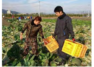
出張きのべ市のための収穫(12/21)