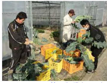
カリフラワー等の収穫(12/02)