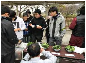
試食にアンケート