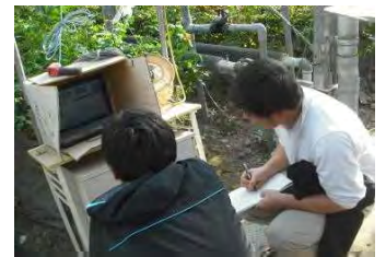
施設内環境をパソコン管理していました。