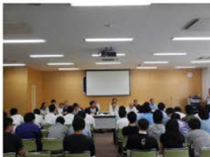
県内12法人の方々が来校 本校模擬会社社長も発言