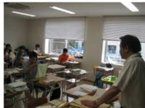
ハローワークの方から説明 模擬面接もマンツーマン