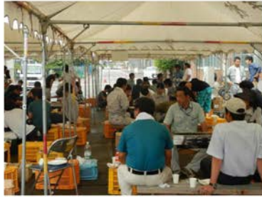
先生方も、くつろいでお食事。

ぶどうを栽培をしています。 旧農大の果樹園で、ぶどう、なし、すだち、もも等さまざまな果樹を育てています。