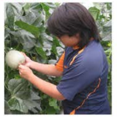
テーマは、6次産業化、低カリウム化、新品種栽培法など。