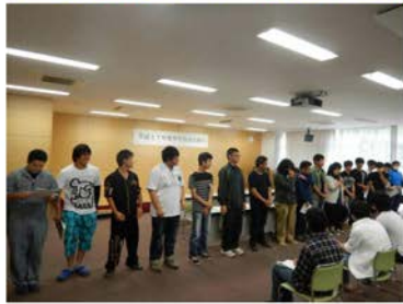
新旧役員が勢揃い。