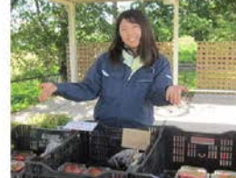
農大前直売所へお越し下さい。