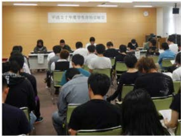
総会での協議は真剣そのもの!