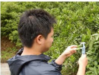
すだちの実の大きさを計測。