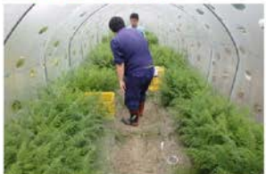
にんじんの収穫をしています。大きさ、重さ、数量を調査!