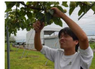
梨の摘果。一つの果実を大きく。