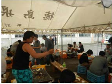
バーベキュー「肉が焼けたよ!」