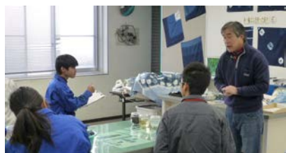
藍染めの基本的な知識に関する講義