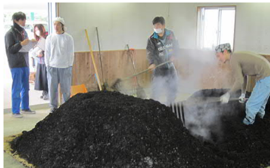
「すくも」の切り返しを体験