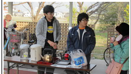
寒いので、阿波番茶でお接待。