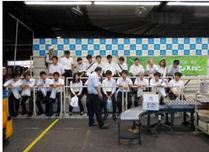
甘藷、レンコン、梨等のセリや仲卸売業者を見学しました。また、この後、会議室へ移動し、意見交換会を実施しました。農業の担い手が高齢化と共に減少していることを市場側も危惧していることから、農大生への期待は大きいとの激励を受けました。