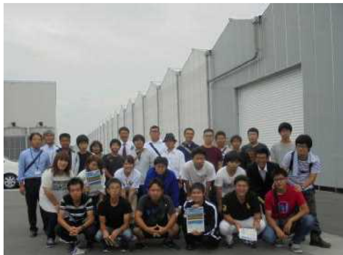
兵庫ネクストファームにて記念撮影。兵庫ネクストファームは、兵庫県が国の補助事業を活用し、設置した施設を利用しています。7月で開設2年になり、昨年度実績は、ミニトマトが反収16t、トマト29tだそうです。