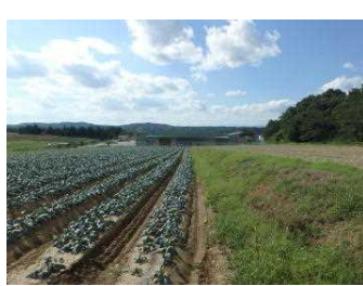
広大な敷地のブロッコリー