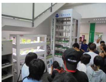
アクアポニックス