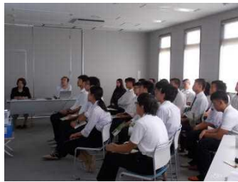
需要が拡大する加工・業務用野菜の現状を学ぶ。