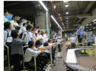
セリ見学等と、意見交換会