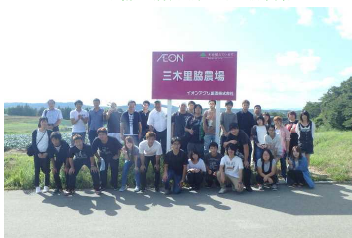
グローバルGAPを取得した11haの農場。イオン店舗の食品残渣等を廃棄物業者が回収し、農場横の堆肥センターで堆肥化処理し、この農場で肥料としてこの堆肥を利用しています。