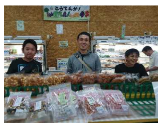
ナカスジファームさんが出展