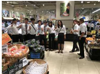
店外にも青果物がずらり 産直市「おひさん市」が店舗内に