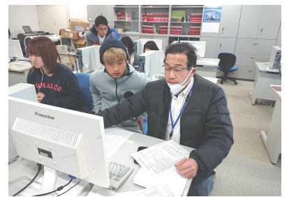
マンツーマンで最終確認！

卒業論文提出締切り！ 2年間の研究の集大成となる卒業論文の提出が、1月25日に締め切られました。日本列島全域にインフルエンザ警報