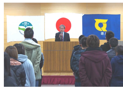
葉柳校長による講話

1月9日の校長講話を皮切りに後期の授業が再開しました。今年度も残り3ヶ月となりましたが、2年次生にとっては卒業論文の提出、1年次生にとってもプロジェクト計画発表会があり、各学年の山場を迎えます。