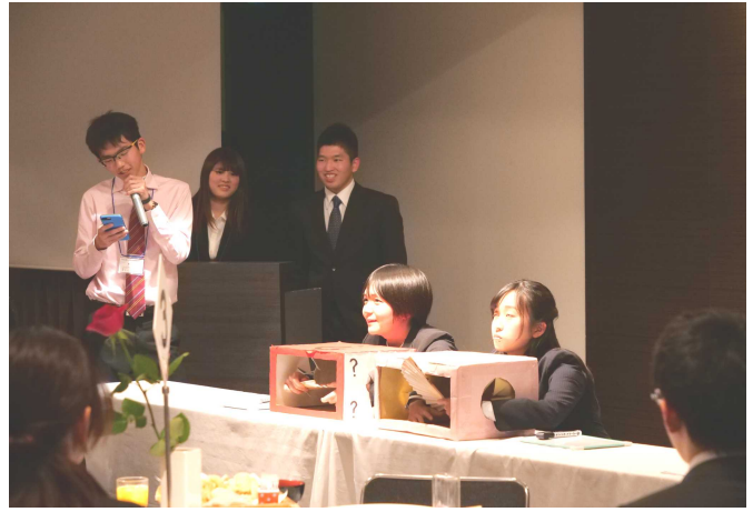
交流会の様子「箱の中身はなあに？」