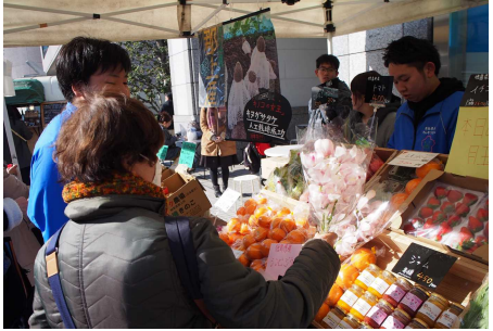
開店直後の販売ブース

段のきのべ市とは勝手が大きく違い、悪戦苦闘することもありましたが、洗練された「プロ」の販売方法を目の当たりにし、大変有意義な研修となりました。