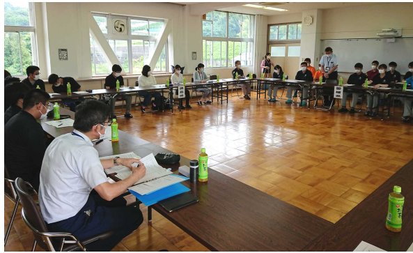
各県の自治会役員が集結

た。徳島農大からは5名の学生自治会役員が参加し、昨年度の事業と会計の報告、今年度の事業計画と予算の確認が行われました。