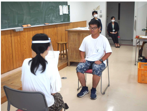
真剣な表情で面接練習！