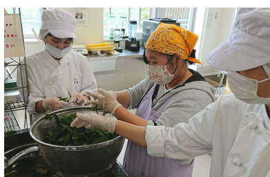
煮出す前に水洗いと異物除去

15日、コース総出で「徳島農大阿波晩茶」用の茶葉の煮出しと踏み込みを行いました。晩茶はよく踏みほど香りが増すと言われており、担当学生が心を込めてひたすら踏み続けました。