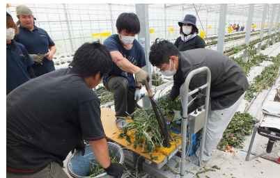
ミニトマト収穫後の片付け作業

2年生が13日と16日の2日に分かれて、ミニトマトの次世代型施設栽培を行っている農業法人「みのるファーム」で実習を行いました。収穫後の茎を細断する専用の機械を使うなど、最先端の管理方法を体験しました。