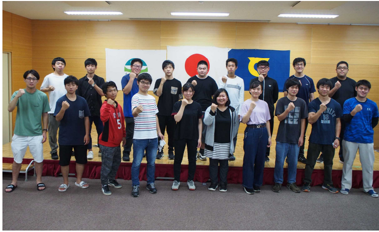
1年生（後列）が加わってガッツポーズの新役員たち

7月6日、学生自治会臨時総会が開催され、6月の定例総会では未確定になっていた1年生の新役員が決定しました。今年度は各自治会行事も新型コロナウイルスの影響を受けることが予想されますが、力を合わせて精一杯盛り上げて行きます！