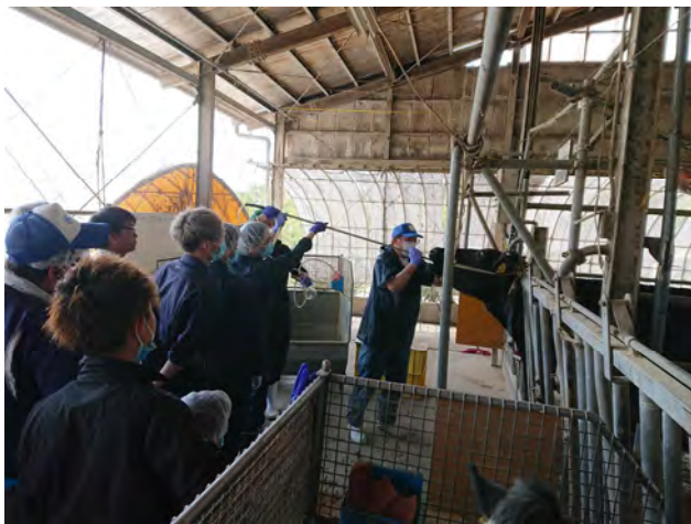
畜産研究所での実習