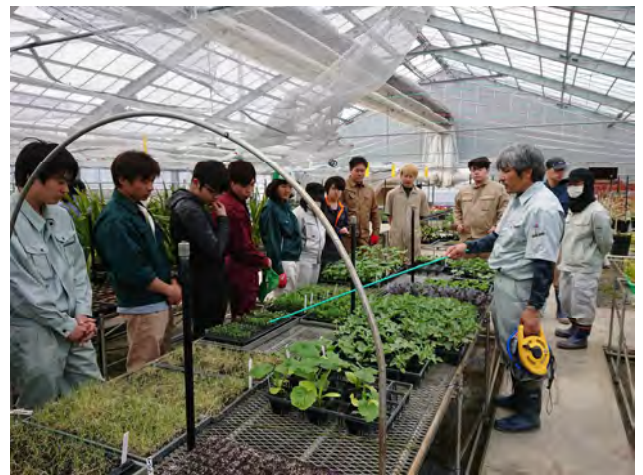
ハウス内で苗の説明