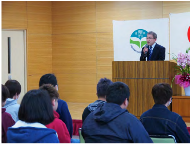
今年度最初の校長講話を熱心に聞く学生たち