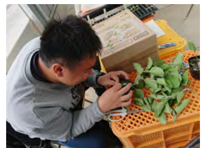
ナスの接ぎ木作業