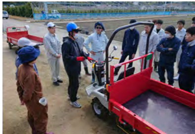
農業機械の安全な使い方を説明

徳島農大では授業時間の約半分が実習になります。高校で農業科だった学生たちも、そうではない学生たちも、新しい環境に目を輝かせて実習に取り組んでいます。