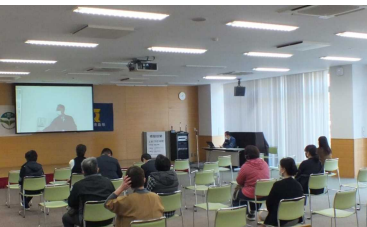
別室から見守る保護者や引率者

今回は従来通りの感染症対策に加え、各授業を選択制にして密集を軽減したり、授業の様子をリモート会議アプリを使って別室のスクリーンに同時配信し、保護者や引率