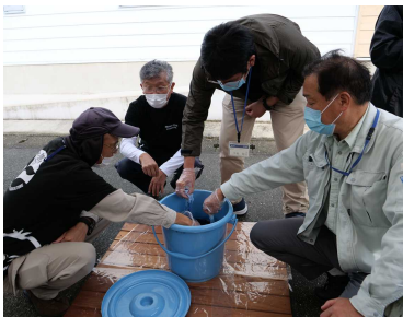
先生方も夢中で藍染め！