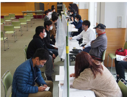
熱心に説明を聞く学生たち