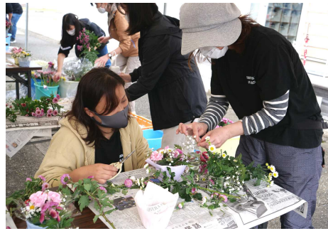
フラワーアレンジメント教室

に藍染め体験やフラワーアレンジメント教室、ドローン操縦教室、木工細工体験といった、農大ならではのワークショップを学生が企画。それぞれのブースを学生や職員が行き交い、「お客無し」の学校祭を楽しみました。