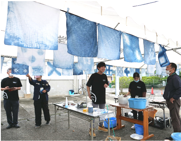
藍染め体験で染めたハンカチ

日、今年度中止になった農大祭の代わりに、校内文化祭が行われました。例年行っていた