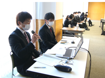
学生の司会進行もスムーズに！

行うのは計画発表会、体験学習報告会に次いで3回目ということもあって、落ち着いた態度で発表できていました。発表後の質疑