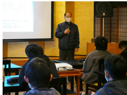
横石社長による講義