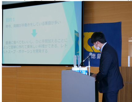
プレゼンも慣れてきました