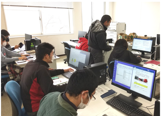
情報処理室で研究成果をまとめる2年生

1年生の2月に行ったプロジェクト計画発表から1年間、学生によってそれぞれ以前から取り組んできた各自の研究の集大成とも言える卒業論文の提出が29日に締め切られました。2年生は情報処理室で必死に論文をまとめました。