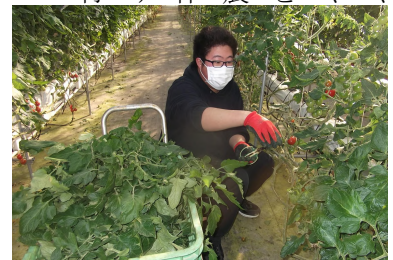
ミニトマトの管理

実際の農家や事業所で農業や食品加工業等を体験する、農業・6次産業体験学習が25日(31日)にかけて行われました。