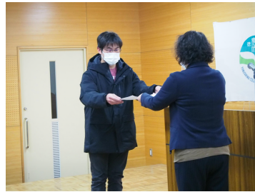
意見発表会最優秀賞を披露

1月は後期末試験や2年生の卒業論文提出、1年生の体験学習などが有り、学生たちにとっては気の引き締まる月です。