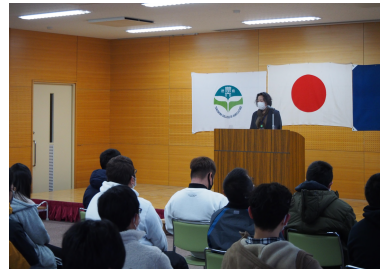
年明け最初の校長講話