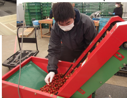
選果前のミニトマトを検品中