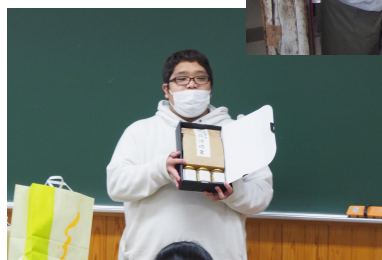
学生が心を込めた手土産を持参!